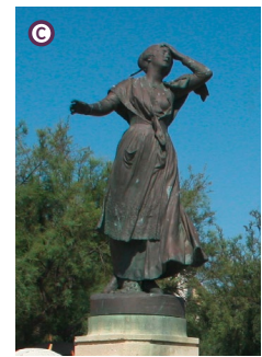
Statue de Mireille