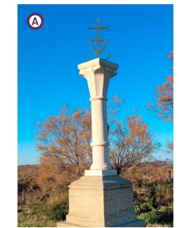
La Croix de Camargue