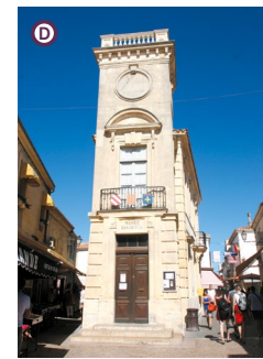
Musée Baroncelli (expositions)