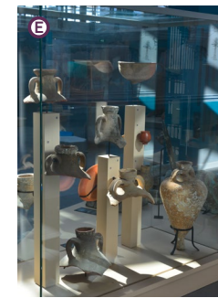
Espace Muséal et Médiathèque